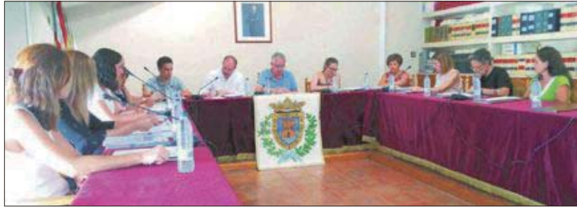
Ple de l'Ajuntament de Castalla

Per això, "demandem un espai per poder desenvolupar el